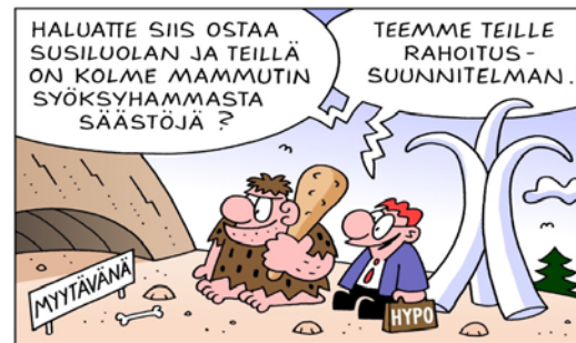
Neuvo 2: Varmista rahoitus ennen kuin sitoudut uuden ostoon