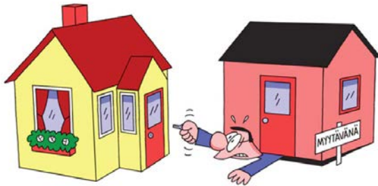
Neuvo 1: Varo kahden asunnon loukkua